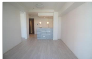
【リビングダイニング】

システムキッチン・ユニットバス・洗浄機能付トイレ新調・フローリング張替・CFシート張替 クロス張替・ハウスクリーニング等