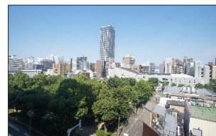
【バルコニーからの眺望】